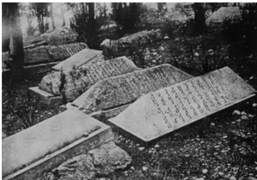
בית הקברות היהודי בספליט

[=הקהל קדוש]. ויהי היום שמינו לאיש חיל רב פעלים ועשה והצליח ותקן פנקס נאה ומתוקן והיה מחלק הקופות מה שנוגע לכל ארץ מארצות הקדש, וכשהיו באים שלוחי א"י היה מוצא כל א' אחד חלקו מבורר על נכון. הנה כאשר ראו יחידי הקהל מעשה ידיו להתפאר נמנו וגמרו למנותו גבאי כל ימי חייו, ומה גם כי כל העדה המה ראו כי האיש הלזה יגע בכל כחו בגופו ובממונו בכל עניני וצרכי צבור וגדולים מעשיו. ולעת זקנתו עשה כתב ליחידי הק"ק לחלות פניהם שכשם שעשו עמו טובה להניחו גבאי כל ימי חייו כן יעשו ג"כ [=גם כן] לבניו כל ימי חייהם וצוה לבניו כי בהגיע קצו קודם שיקברו יראו כתב זה להצבור וכן עשו הבנים וקראו הכתב במעמד כל יחידי הק"ק וכלם ענו אחריו אמן. והן עתה אחרי מות בניו ונשאר בן בנו יצא לטעון להמנות לגבאי מתורת ירושה כי הוא ממלא מקום אבותיו בכל מכל כל ויש מערערים בדבר. 57