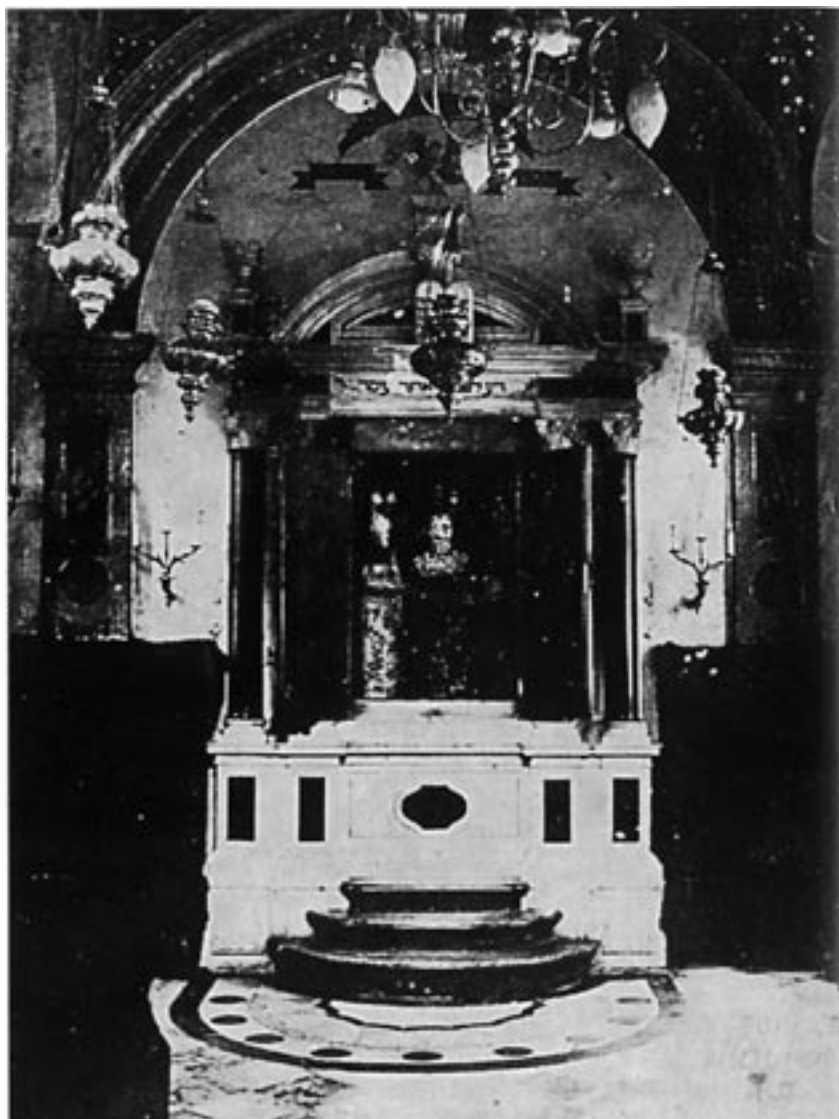
פנים בית הכנסת בספליט

בעת שהותם בעיר ורונה, ושד"רי חברון: ר' רחמים חיים באג'איו ויצחק זאבי, שכתבו הסכמה בהיותם בליוורנו. 5