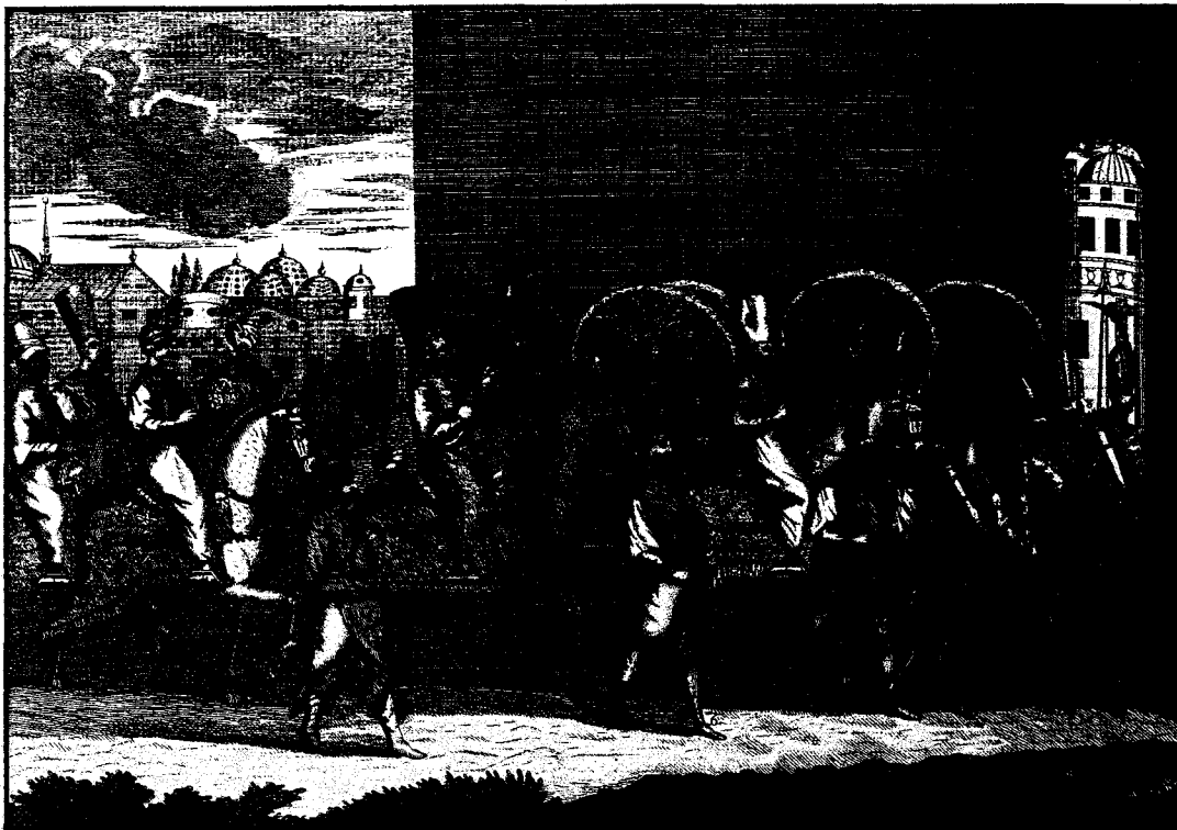
תהלוכת הסולטן באיסטנבול, תחריט מן המאה ה-18