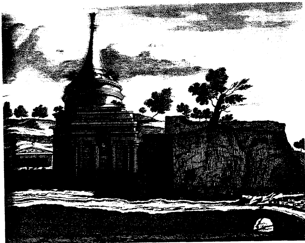
16 ש' סימנוסון, תולדות היהודים בדוכסות מנטובה, א, ירושלים תשכ"ג, עמ' 350. 17 בן-נאה (לעיל, הערה 13), עמ' 104-106.

יד אבשלום נחל קדרון, תחריט מתוך ספרו של קורגליס דה-ברוין (דלפט 1698)